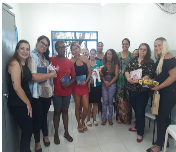
Ação no Cras Ângelo Tomazin Dall'Orto