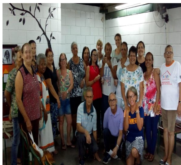
Ação com grupo da terceira idade -scfv