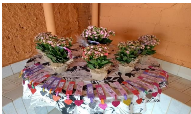
Ação no SCFV Manchester