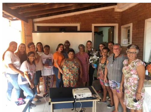
Ação no SCFV Salerno